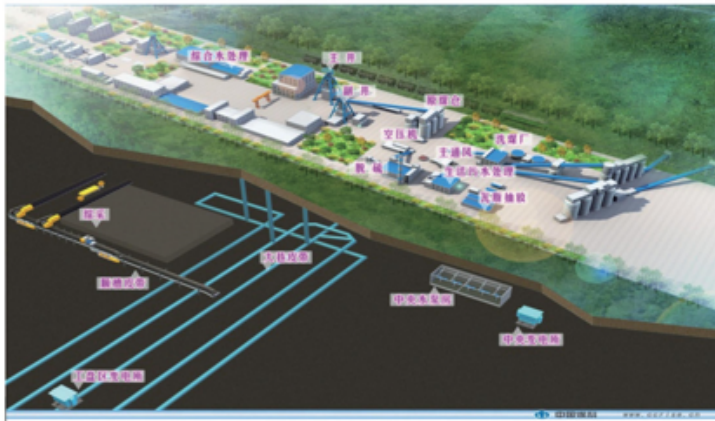
综合自动化监控系统主界面