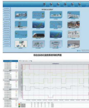
综合自动化监控系统趋势曲线